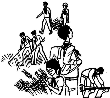
Рис. О. КОПНЕВА.